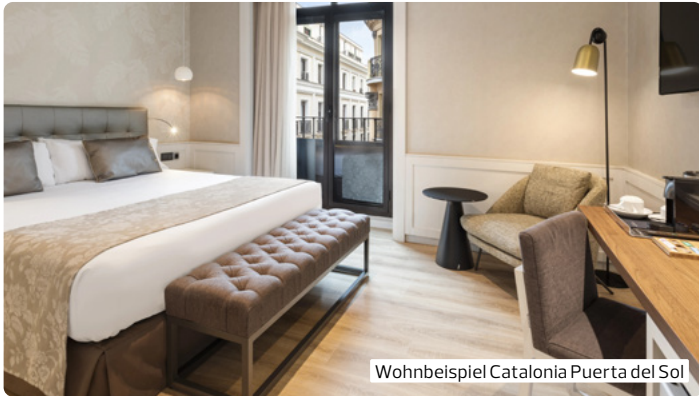
Wohnbeispiel Catalonia Puerta del Sol