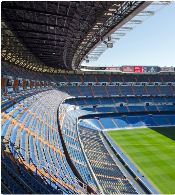
Kat. 1 Exzellenz