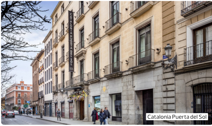
Catalonia Puerta del Sol