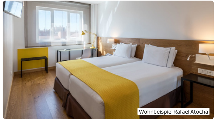
Wohnbeispiel Rafael Atocha