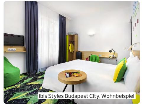
ibis Styles Budapest City, Wohnbeispiel