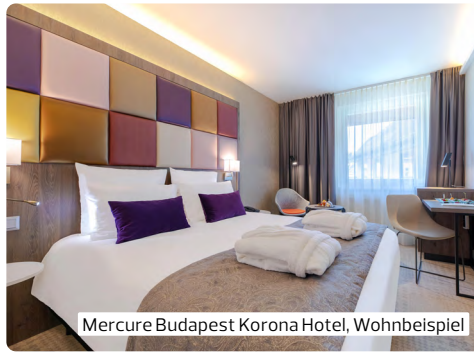
Mercure Budapest Korona Hotel, Wohnbeispiel