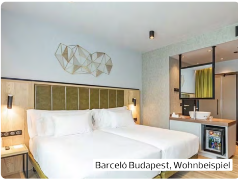
Barceló Budapest, Wohnbeispiel