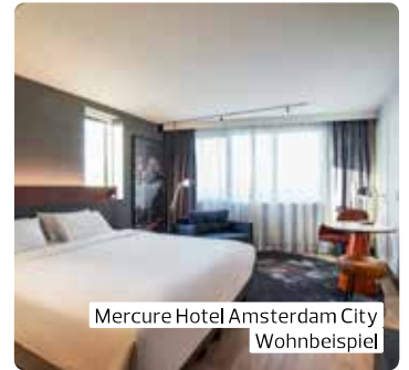
Mercure Hotel Amsterdam City Wohnbeispiel