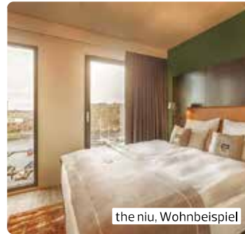
the niu, Wohnbeispiel