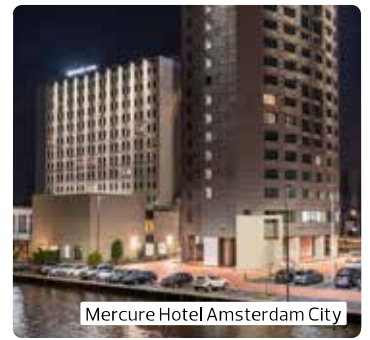
Mercure Hotel Amsterdam City