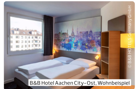
B&B Hotel Aachen City-Ost, Wohnbeispiel