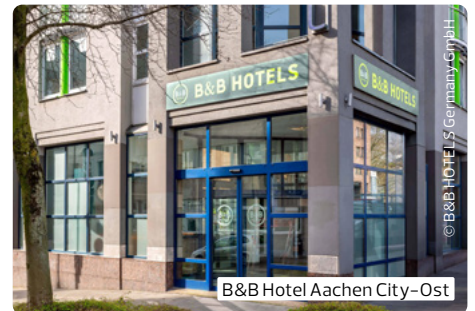
B&B Hotel Aachen City-Ost