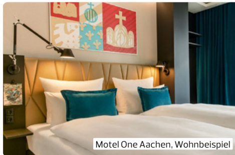
Motel One Aachen, Wohnbeispiel