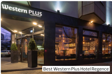
Best Western Plus Hotel Regence