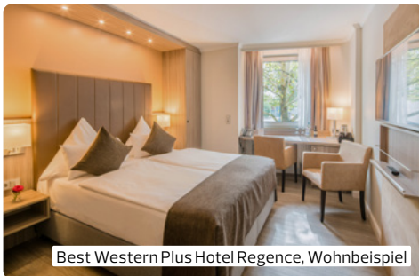
Best Western Plus Hotel Regence, Wohnbeispiel