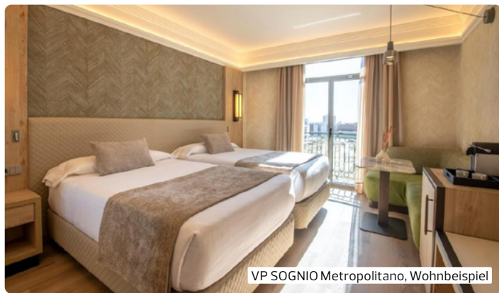
VP SOGNIO Metropolitano, Wohnbeispiel