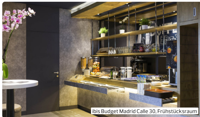
ibis Budget Madrid Calle 30, Frühstücksraum