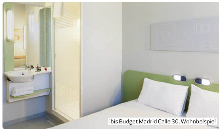
ibis Budget Madrid Calle 30, Wohnbeispiel