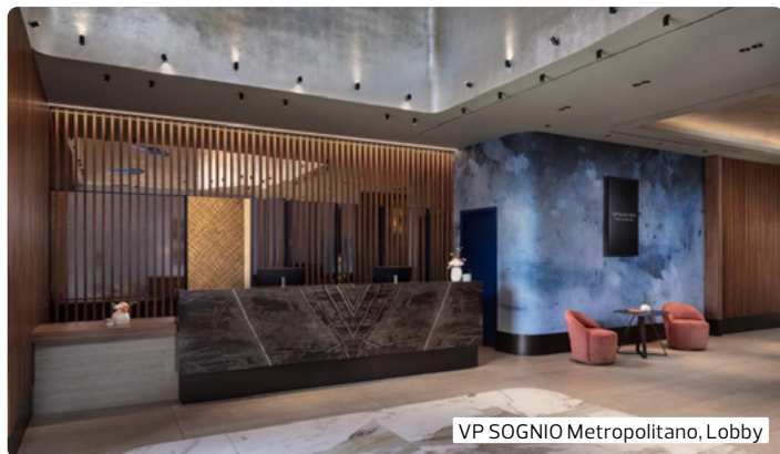
VP SOGNIO Metropolitano, Lobby